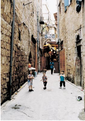
ベイルートの路地裏の子供達