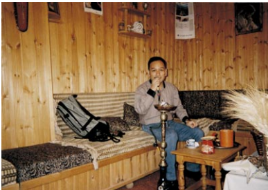
水パイプをすすめられて“スイマセン” 私はタバコをスイマセン