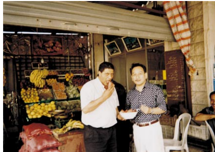
ドライブの途中のどが乾いたので果物屋に寄る