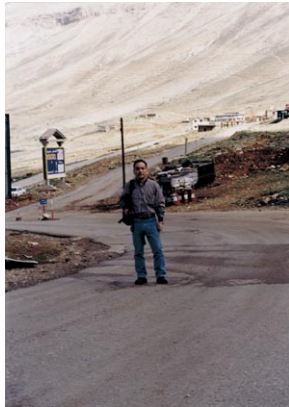
レバノンの国境警備隊の戦車の前でパチリ